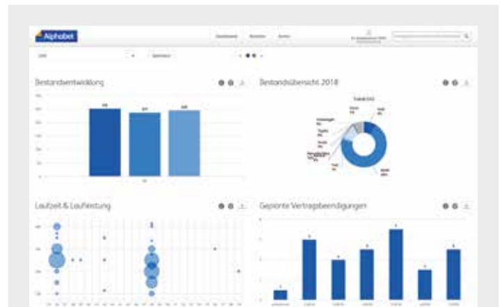
Übersichtsdashboard: Alle wichtigen Informationen auf einen Blick.

Wichtige Kennzahlen wie zum Beispiel Daten zur Bestandsübersicht, die Verteilung der Laufzeit / Laufleistung oder zukünftige Vertragsbeendigungen werden in einem Dashboard übersichtlich und optisch ansprechend dargestellt.