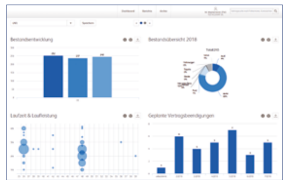
Übersichtsdashboard: Alle wichtigen Informationen auf einen Blick.

Wichtige Kennzahlen wie zum Beispiel Daten zur Bestandsübersicht, die Verteilung der Laufzeit/Laufleistung oder zukünftige Vertragsbeendigungen werden in einem Dashboard übersichtlich und optisch ansprechend dargestellt.